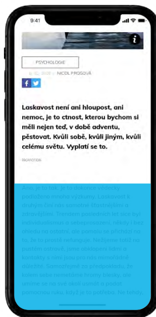
INTERSCROLLER MOBILE RECTANGLE