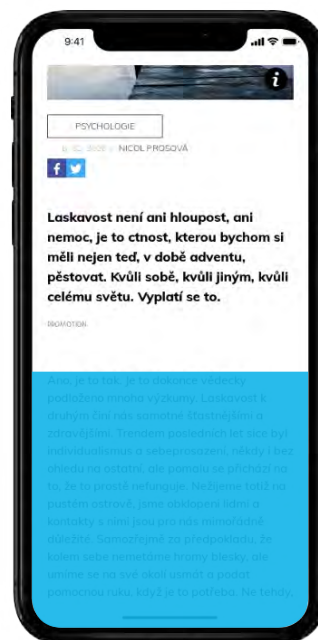
INTERSCROLLER MOBILE RECTANGLE