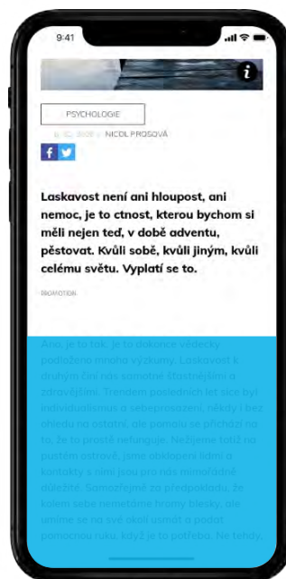
INTERSCROLLER MOBILE RECTANGLE